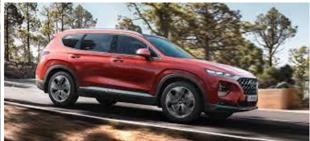
Hyundai SANTA FE Plug-In-Hybrid

Sowohl der Hyundai TUCSON mit neuem Außendesign und seinem vollständig neu gestalteten Innenraumkonzept wie auch der Hyundai SANTA FE verfügen jetzt über einen hochmodernen Plug-In-Hybrid-Antrieb und können durch diese Technik von der steuerlichen Begünstigung als Dienstwagen profitieren.