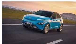
Hyundai KONA Elektro

Sowohl der Hyundai TUCSON mit neuem Außendesign und seinem vollständig neu gestalteten Innenraumkonzept wie auch der Hyundai SANTA FE verfügen jetzt über einen hochmodernen Plug-In-Hybrid-Antrieb und können durch diese Technik von der steuerlichen Begünstigung als Dienstwagen profitieren.