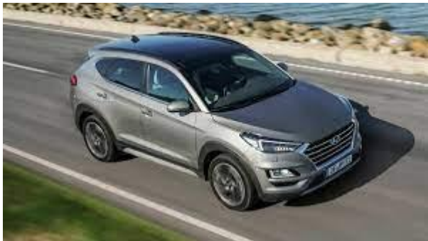
Hyundai TUCSON Plug-In-Hybrid

„Innovation ist der beste Antrieb für wirtschaftlichen Erfolg - und Wirtschaftlichkeit die Basis“